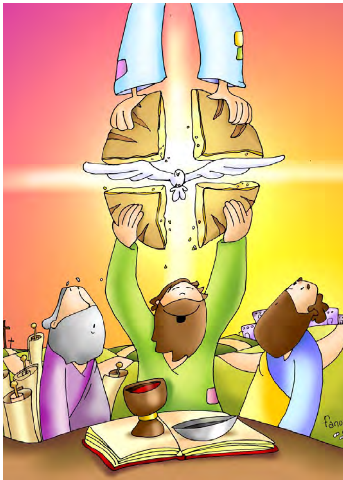
TEXTO: JESÚS ES EL SEÑOR. CATECISMO DE LA CEE PARA LA INICIACIÓN SACRAMENTAL

Con Jesús nosotros podemos ofrecernos al Padre y formar una comunidad de hermanos por la acción del Espíritu Santo.