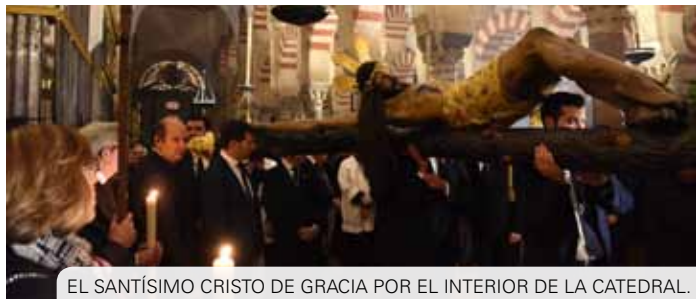
EL SANTÍSIMO CRISTO DE GRACIA POR EL INTERIOR DE LA CATEDRAL.

La cita culminó con la celebración de la misa en la Catedral, donde el pastor de la Diócesis animó a los presentes a vivir intensamente la Cuaresma y agradeció públicamente todo el trabajo que las hermandades realizan.