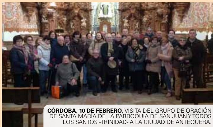
CÓRDOBA, 10 DE FEBRERO. VISITA DEL GRUPO DE ORACIÓN DE SANTA MARÍA DE LA PARROQUIA DE SAN JUAN Y TODOS LOS SANTOS -TRINIDAD- A LA CIUDAD DE ANTEQUERA.