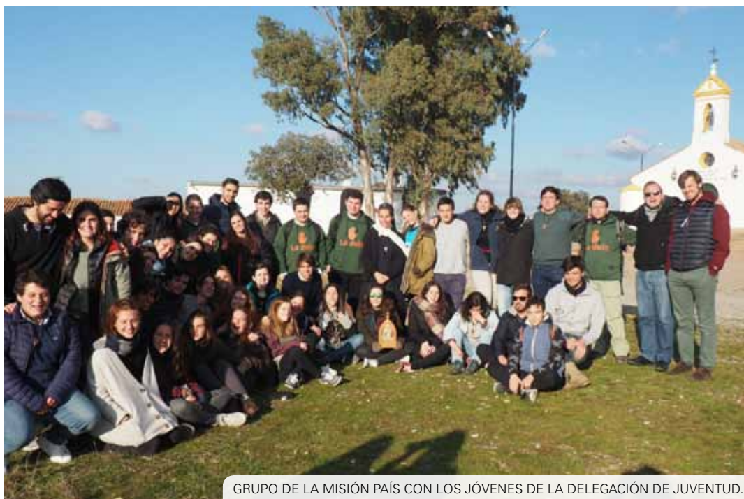
GRUPO DE LA MISIÓN PAÍS CON LOS JÓVENES DE LA DELEGACIÓN DE JUVENTUD.

Durante una semana unos 250 jóvenes universitarios han sido misioneros de otros jóvenes en las localidades de Espiel, Peñarroya, Pedroche, El Viso, Añora e Hinojosa del Duque