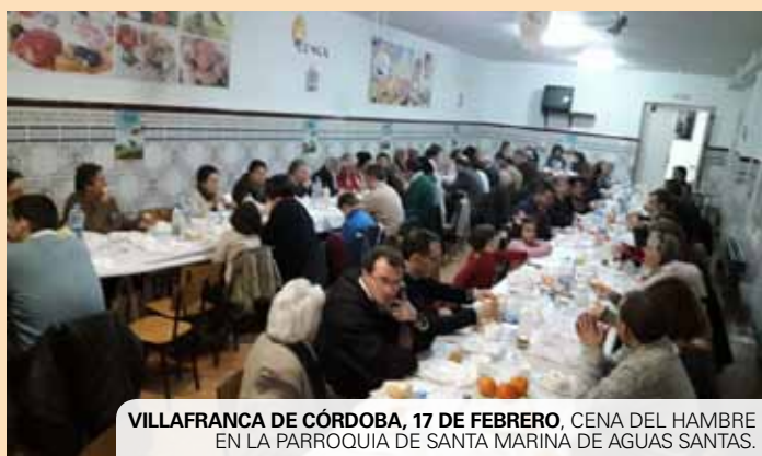
VILLAFRANCA DE CÓRDOBA, 17 DE FEBRERO. CENA DEL HAMBRE EN LA PARROQUIA DE SANTA MARINA DE AGUAS SANTAS.