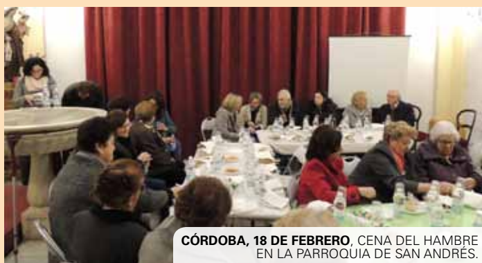
CÓRDOBA, 18 DE FEBRERO. CENA DEL HAMBRE EN LA PARROQUIA DE SAN ANDRÉS.