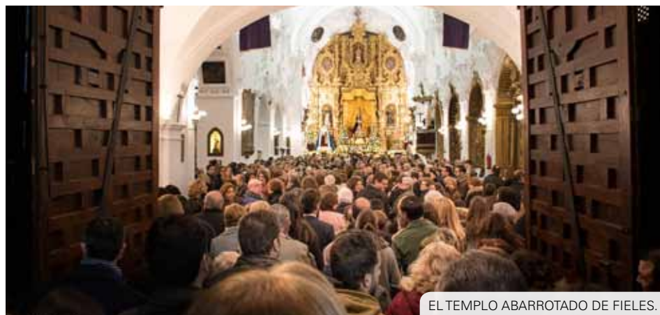
EL TEMPLO ABARROTADO DE FIELES.