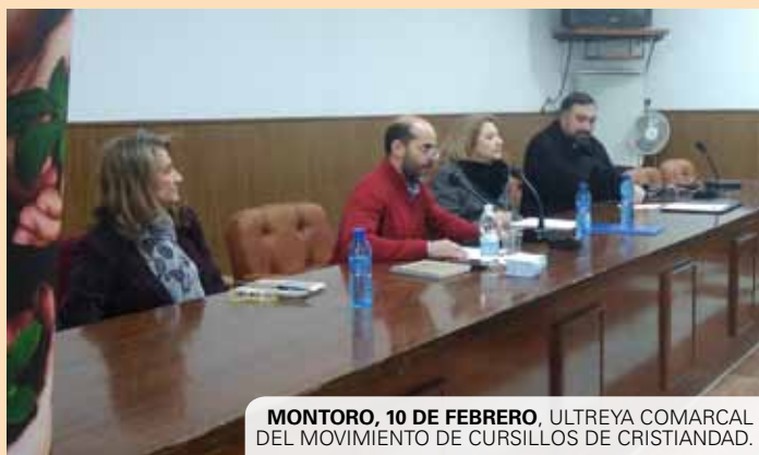
MONTORO, 10 DE FEBRERO. ULTREYA COMARCAL DEL MOVIMIENTO DE CURSILLOS DE CRISTIANDAD.