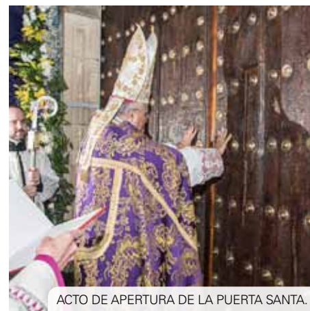
ACTO DE APERTURA DE LA PUERTA SANTA.

zareno, así como las condiciones para lucrar la indulgencia plenaria. En la homilía, Don Demetrio recordó cómo se fueron dando los pasos para la concepción de este Año de Gracia y cómo descubrió que “mover al nazareno, es mover a todo el pueblo”. Finalmente, animó a la Hermandad y a todos los fieles a lucrarse de las gracias del Año Jubilar y a recibir a todos los peregrinos.