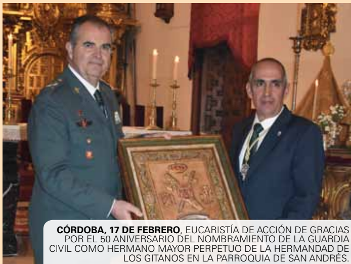
CÓRDOBA, 17 DE FEBRERO. EUCARISTÍA DE ACCIÓN DE GRACIAS POR EL 50 ANIVERSARIO DEL NOMBRAMIENTO DE LA GUARDIA CIVIL COMO HERMANO MAYOR PERPETUO DE LA HERMANDAD DE LOS GITANOS EN LA PARROQUIA DE SAN ANDRÉS.