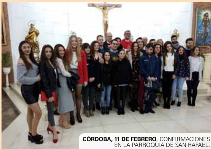
CÓRDOBA, 11 DE FEBRERO. CONFIRMACIONES EN LA PARROQUIA DE SAN RAFAEL.