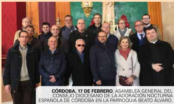
CÓRDOBA, 17 DE FEBRERO. ASAMBLEA GENERAL DEL CONSEJO DIOCESANO DE LA ADORACIÓN NOCTURNA ESPAÑOLA DE CÓRDOBA EN LA PARROQUIA BEATO ÁLVARO.