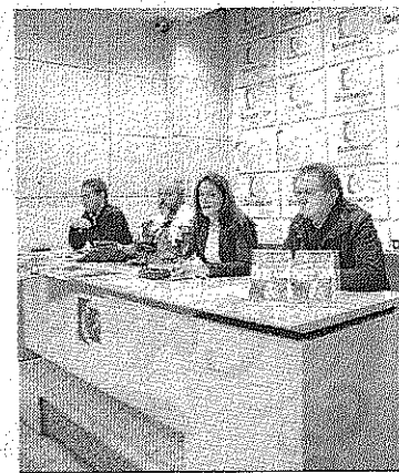
Imagen de la presentación de la fiesta.

Entre las principales novedades de la fiesta para este año están la invitación al municipio de Pozoblanco, que mostrará en un puesto todos sus recursos y lleva a Dos Torres la actuación de varias compañías locales, la proyección de un videomapping en la fachada de la iglesia de la Asunción y la acuñación de una moneda especial, "los cuartos de la candelaria", para comprar en los mercados y establecimientos de la localidad durante los días de la fiesta.