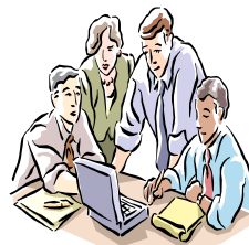
Trabajo en grupo

Trabajo elaborado en el grupo a enviar a la Delegación Diocesana de Enseñanza: